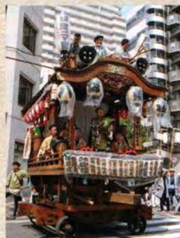
桜町二丁目の屋台 単層踊屋台 住居表示変更にもない昭和54年(1979)に山車を新調。新調を記念して同じ年に東京銀座祭りに参加。