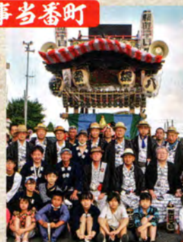
桜町一丁目の屋台 獅子屋台 昭和62年(1987)制作。平成3年、獅子屋台を回転式、櫓設置に改装。