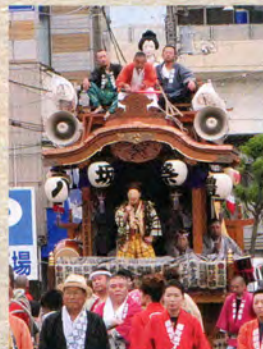
桜町四丁目の山車 三層人形山車 平成7年(1995)制作。人形「卓卓呼」は平成15年作。