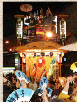
桜町三丁目の山車 三層人形山車 平成11年(1999)、山車の上部を再改装。人形「神武天皇」は平成15年作。