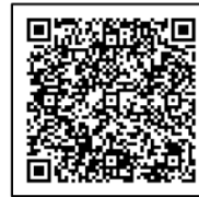
マイページURL QRコード